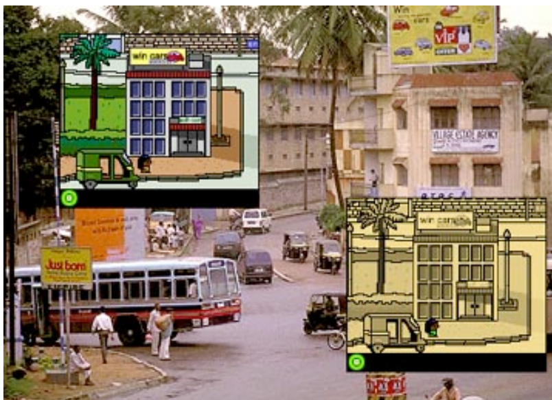
Bildschirm-Still aus dem Konzept für Mental imMigration (2001)

Knowbotic Research realisierten mit Mental imMigration ein Konzept für einen kollektiv erarbeiteten virtuellen Raum, welcher allen Beteiligten eine spielerische Annäherung an die neuen Formen globaler Tele-Arbeit erlaubt.