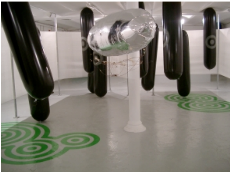
Naked Bandit / here, not here / white sovereign (2004)

Die Installation war Teil der Ausstellung Mapping New Territories in der Neuen Kunst Halle St. Gallen von Januar bis März 2005.