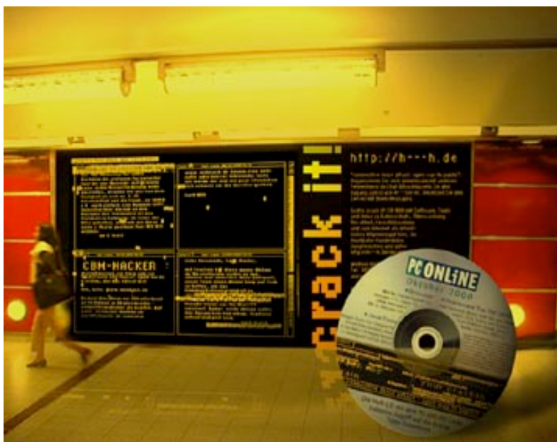
connective force attacks: open way to public (2000), der Bildschirm der Aktion von Knowbotic Research in der Hamburger U-Bahn.

Über die einfach zu bedienende Software, die massenhafte Streuung der Gratis-CD-Rom und über Plakate gelang es Knowbotic Research , ein breiteres Publikum zu erreichen. Allerdings wurde der Infoserver bereits zwei Tage vor der Auslieferung der CD-Rom, die das sechs Wochen dauernde Projekt einleitete, durch professionelle Hacker besetzt. Erst nach einer Weile konnten auch andere ihre Inhalte auf dem Bildschirm zeigen.