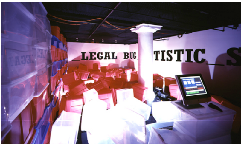
Minds of Concern: breaking news , (2002). Installation, mit der der Zugriff auf andere Rechner erlaubt und erprobt wurde.

Redaktion Kurzdossier: MH, Stand Juli 2005.